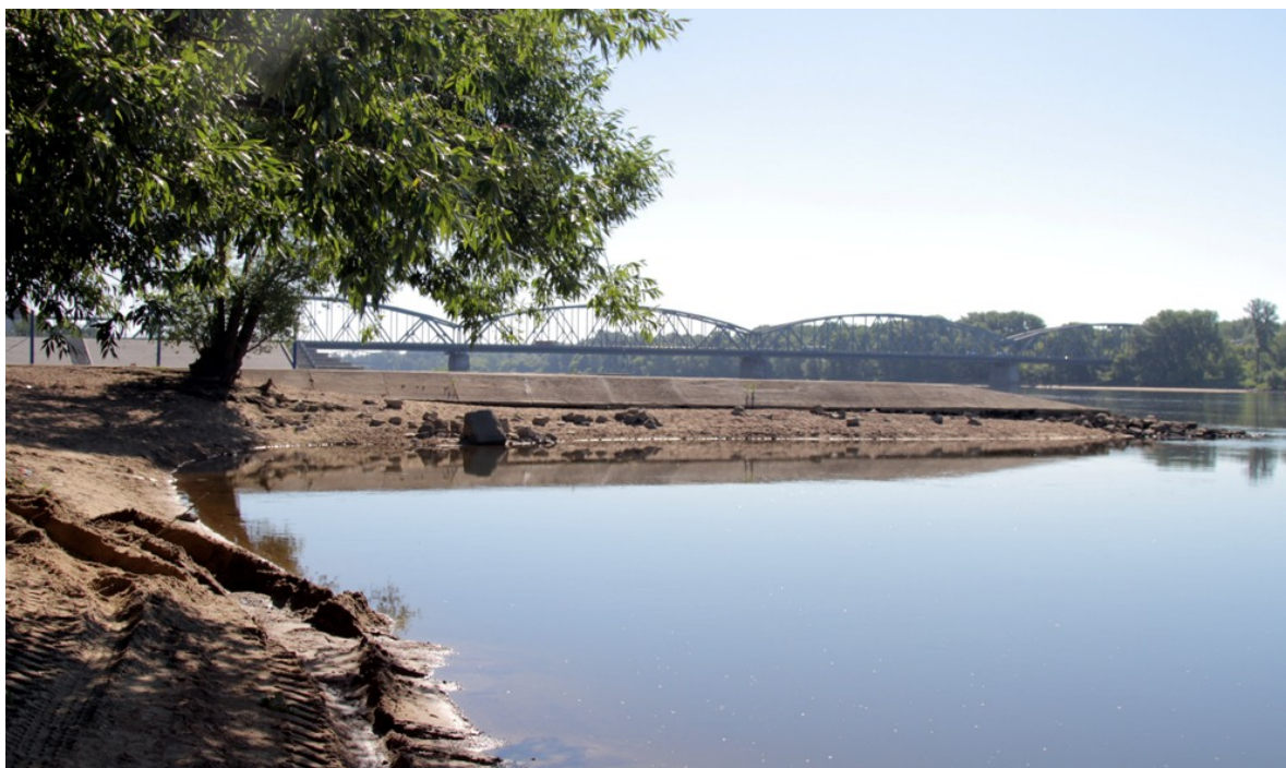
Przy Przystani AZS