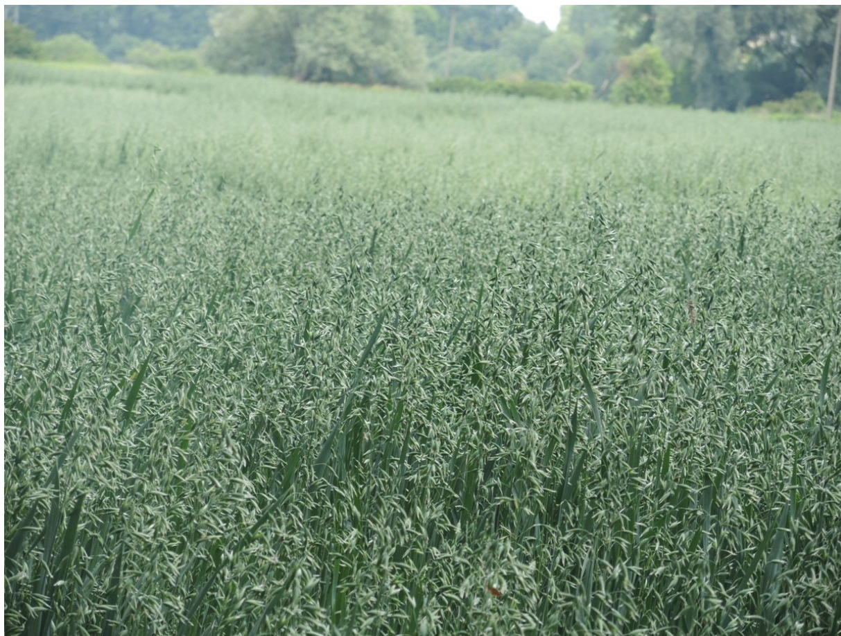
Pola uprawne