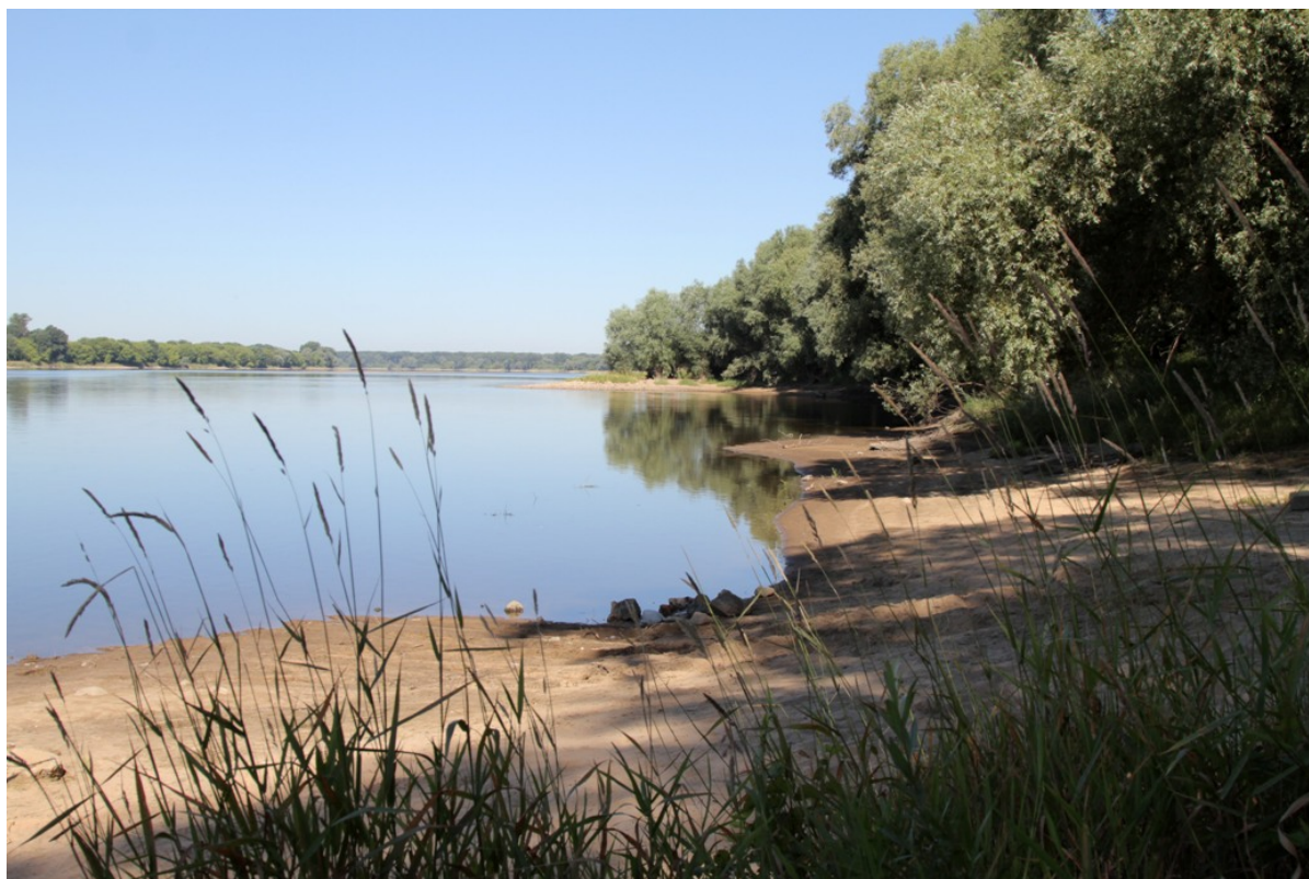
Brzeg Wisły