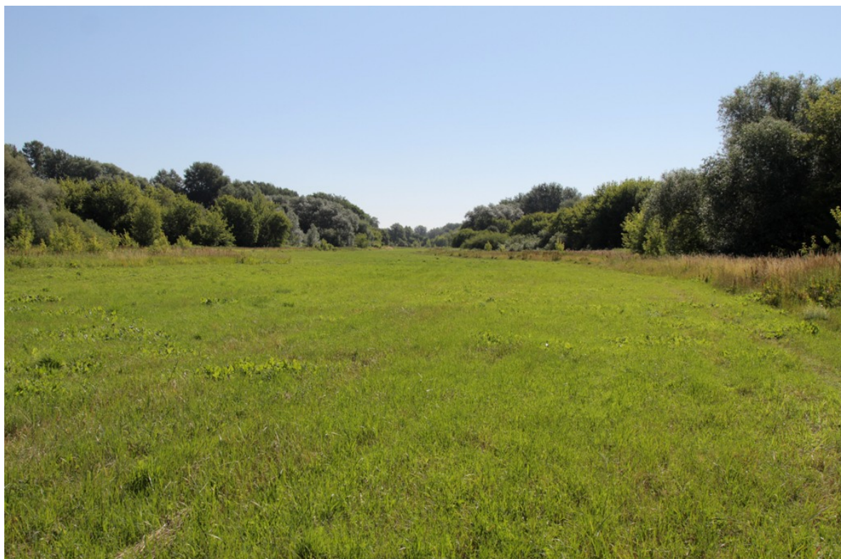
Błonia przy Martówce