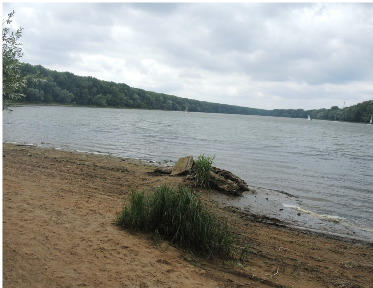
Port Drzewny