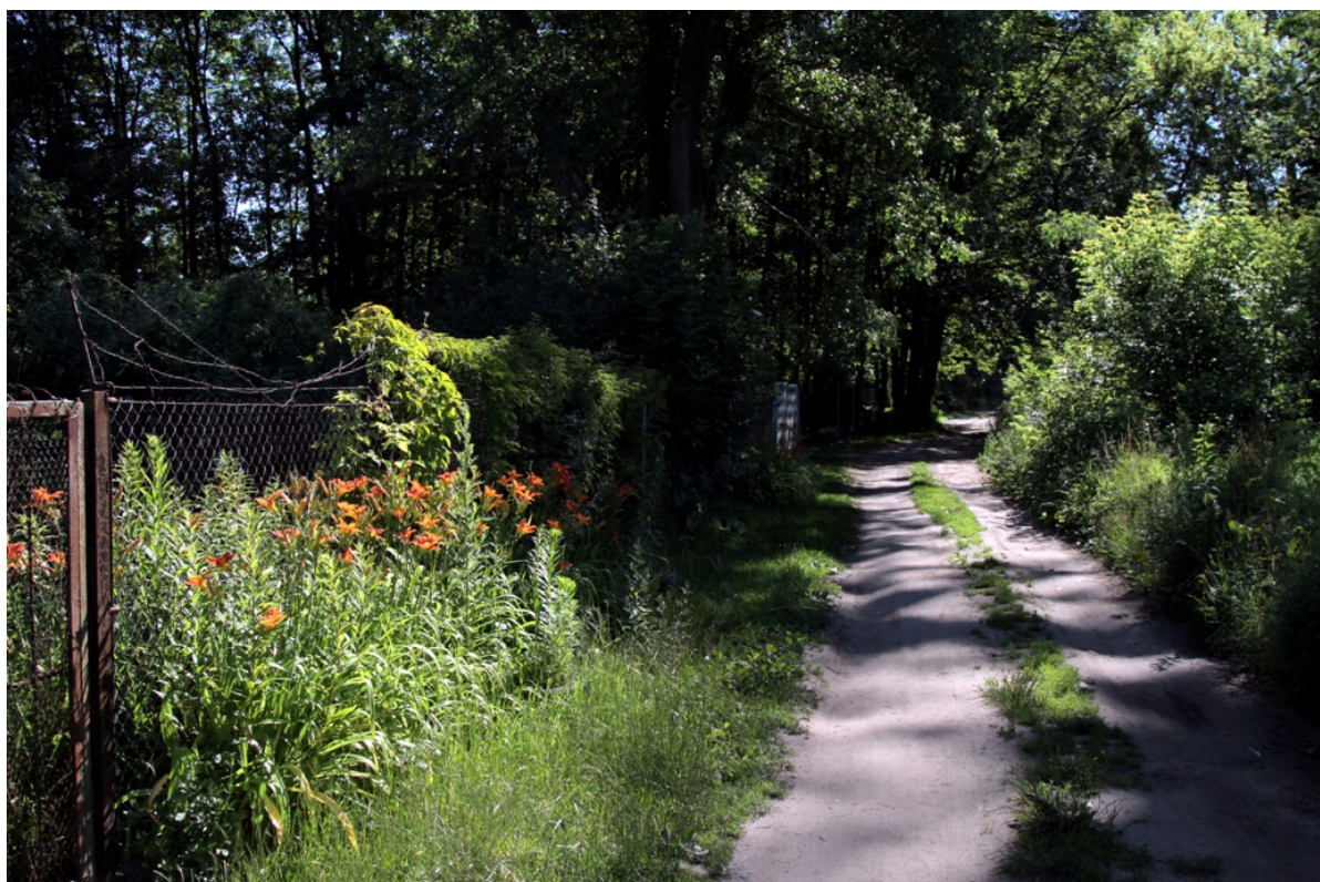
Droga przy ogródkach działkowych