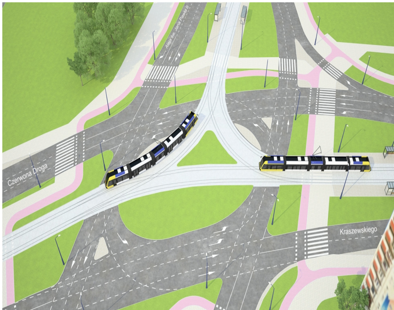
plac Artylerii Polskiej w wariacie3: