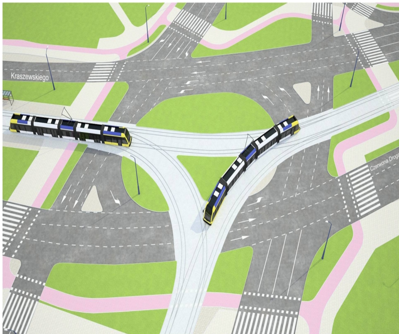
plac Artylerii Polskiej w wariancie 1: