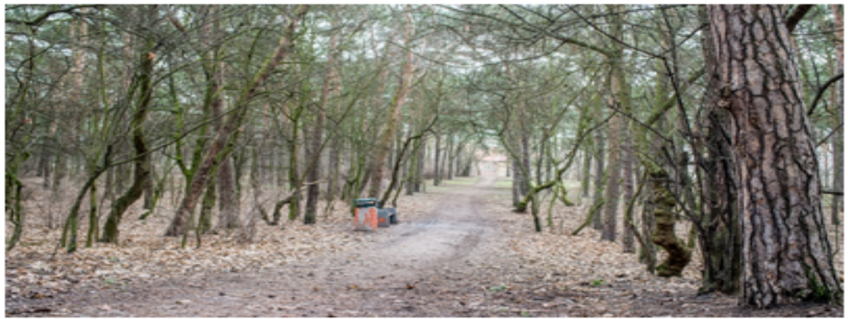
Pickerałkie Góry (na zdjęciu) zostały zagospodarowane w ostatnich latach. Teraz czas na kolejno trzy tereny leśne w mieście

Mieszkańcy Torunia w ramach konsultacji będą mogli zdecydować, jak zostaną zagospodarowane trzy kompleksy lasów miejskich.