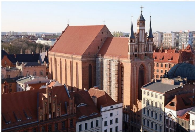
Toruń do Polski wšodł dopiero w 1925 roku

Toruń stara się o uzyskanie tytułu „Miasto przyjazne dzieciom”. To program UNICEF, którego celem jest poprawa jakości życia najmłodszych mieszkańców.