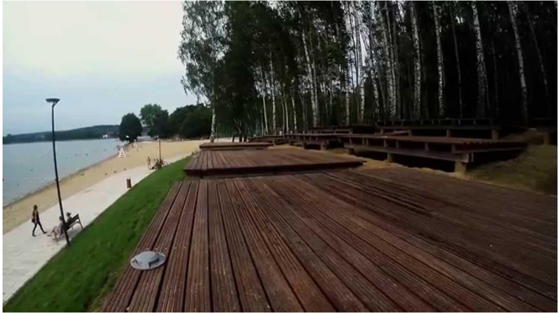
Ryc. 4 Tarasy na plaży miejskiej jeziora Ukiel

Cała powierzchnia stawu wymaga oczyszczenia, bagrowania, a jego skarpy należy wzmocnić. W tym celu doskonale nada się naturalne umocnienie w formie zielonych płotków faszynowych. Przy brzegach i na skarpach zastosowana będzie również roślinność wodnolubna, która dodatkowo usztywni ziemię.