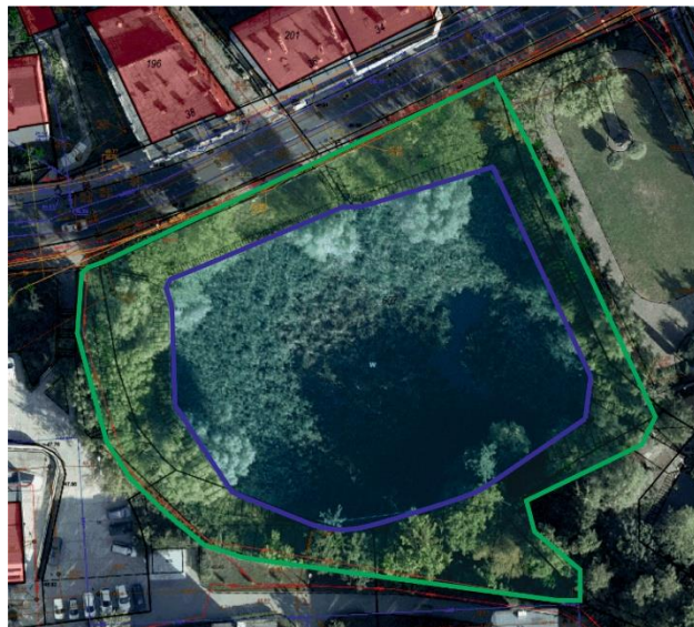
Ryc. 2 Rzut działki nr 607 obręb 70

Powierzchnia działki łącznie ma 5000m 2 , z czego powierzchnia stawu to 2800m 2 , a tereny zielone zajmują 2200m 2 .