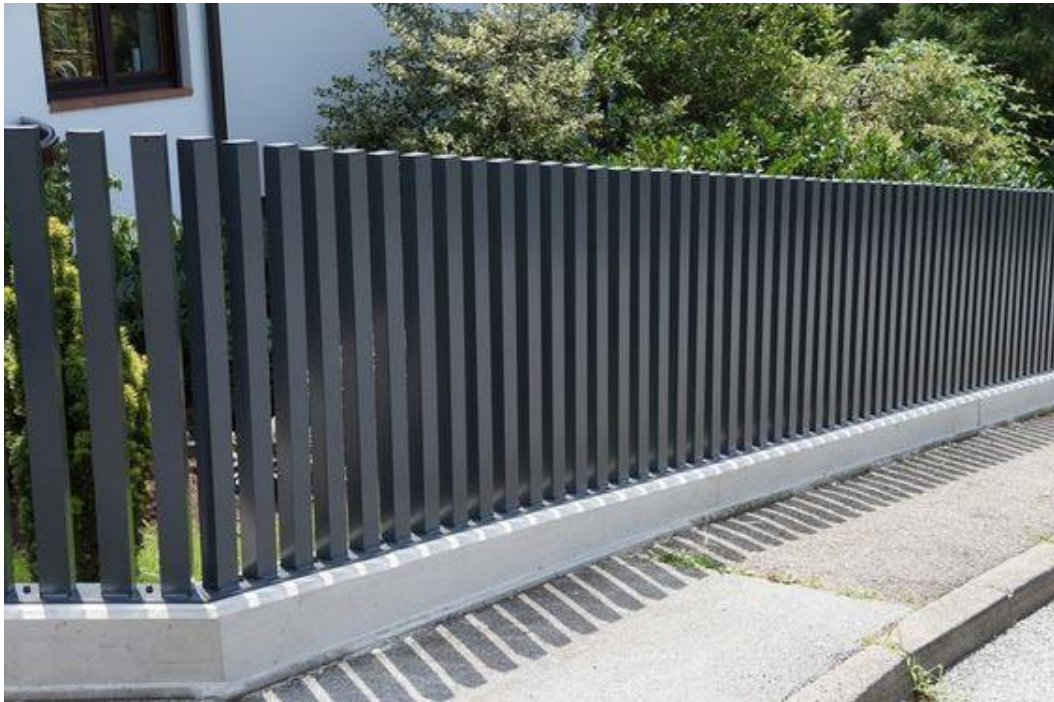
Ryc. 5 Ogrodzenie palisadowe

wodnego od strony ulicy Poznańskiej, drugiego zaś całkowite usunięcie. Trzeci ciek wodny od strony południowej, jest okresowy, dlatego zaleca się jego wykorytowanie, umocnienie dna kamieniami polnymi, a brzegi umocnić faszyną.