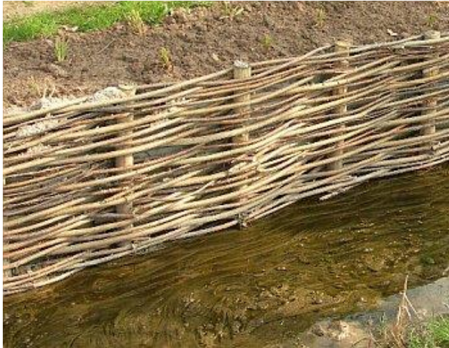
Ryc. 6 Parzone płotki faszynowe