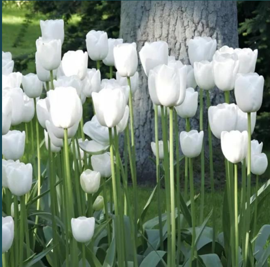
TULIPANY W BIAŁYM KOLORZE