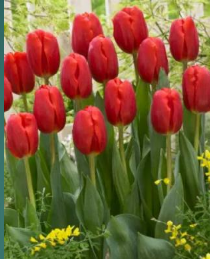
TULIPAN W CZERWONYM KOLORZE