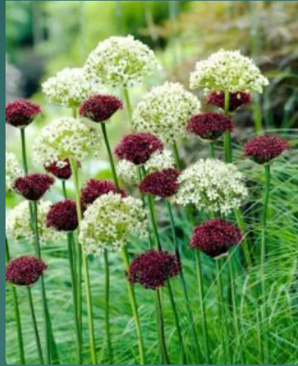
CZOSNEK W FORMIE OZDOBNEJ