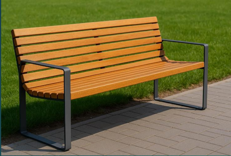
ŁAWKA Z OPARCIEM I PODŁOKIETNIKAMI