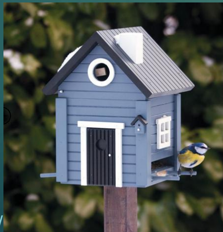
KARMNIK DLA PTAKÓW