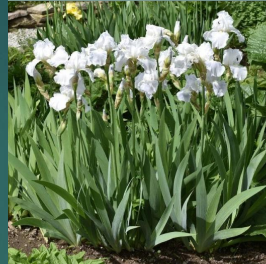
IRYS W BIAŁYM KOLORZE