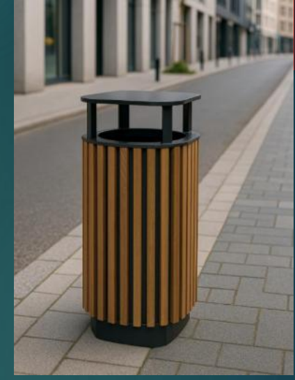
KOSZ NA ODPADY