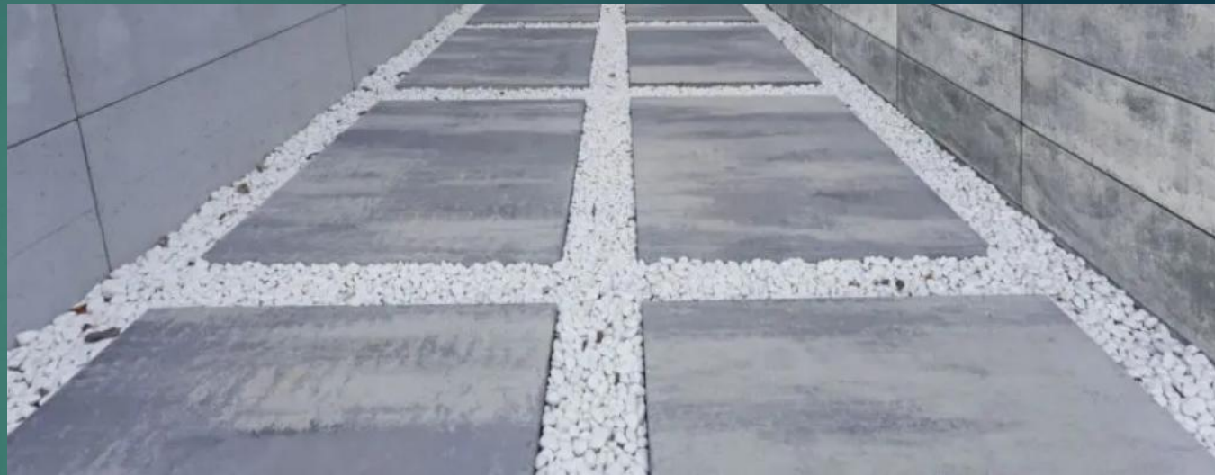
NAWIERZCHNIA Z PŁYT BETONOWYCH