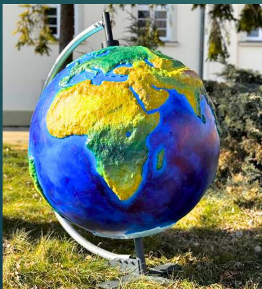
GLOBUS Z GRAWEREM BUŁGARII