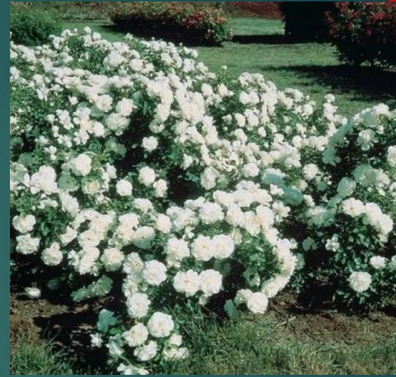
RÓŻE W BIAŁYM KOLORZE