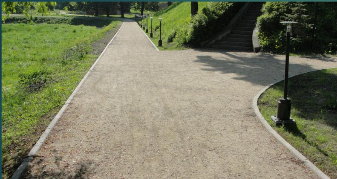
NAWIERZCHNIA TYPU HANSE GRAND