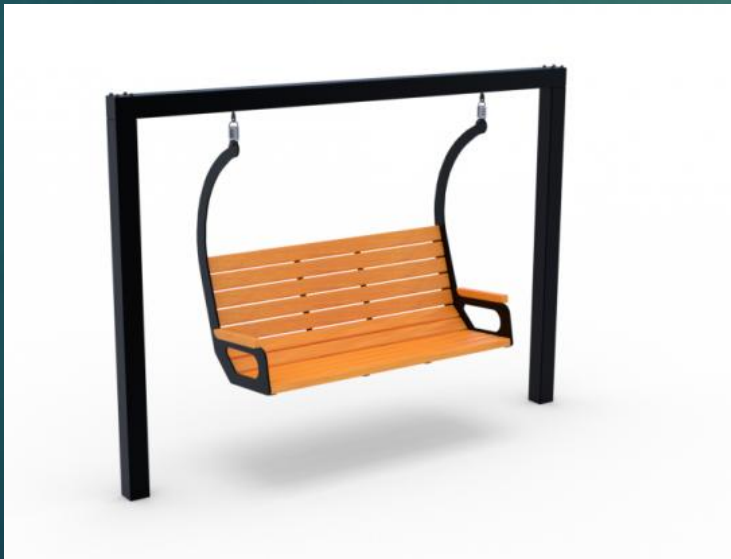
ŁAWKA W FORMIE HUŚTAWKI