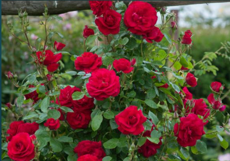
RÓŻE W KOLORZE CZERWONYM