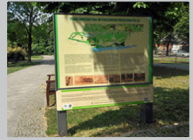
Rewitalizacja zabytkowego Parku Miejskiego na Bydgoskim Przedmieściu w Toruniu - 3 Etap