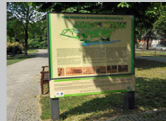
Rewitalizacja zabytkowego Parku Miejskiego na Bydgoskim Przedmieściu w Toruniu - 3 Etap