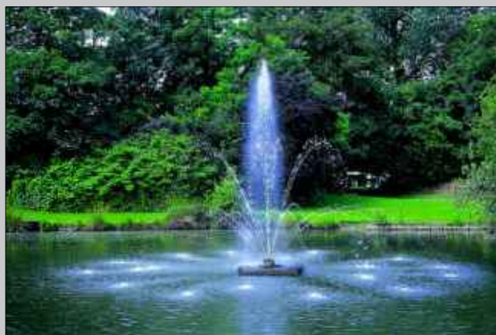
Na stawie umieszczona zostanie fontanna napowietrzająca w osi spływającej wody z kaskady.