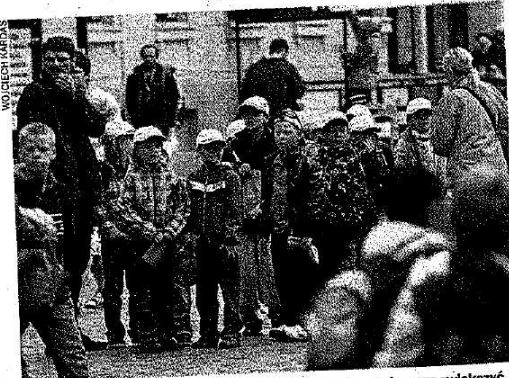
Ruch turystyczny w Toruniu już jest niemały, ale można go jeszcze zwiększyć

Ekspert z WYG International zwraca też uwagę, że nasze miasto jest kojarzone z Radiem Maryja i o. Tadeuszem Rydzkiem, tymczasem tylko promili badanych deklaruje, że odwiedza Toruń z pobudek religijnych. „We współpracy z władzami i osobami duchownymi powinny zostać podjęte zorganizowane działania na rzecz rozwoju tego segmentu turystyki” - postulują.