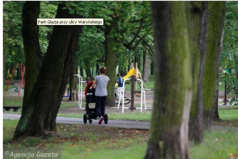
Park Glazja przy ulicy Waryńskiego

Urzednicy pytają mieszkańców o to, co jest szczególnie warte zachowania oraz jakie atuty i słabe punkty mają Chelmińskie Przedmieście oraz Jakubskie-Mokre. Rozpoczął się drugi etap konsultacji społecznych