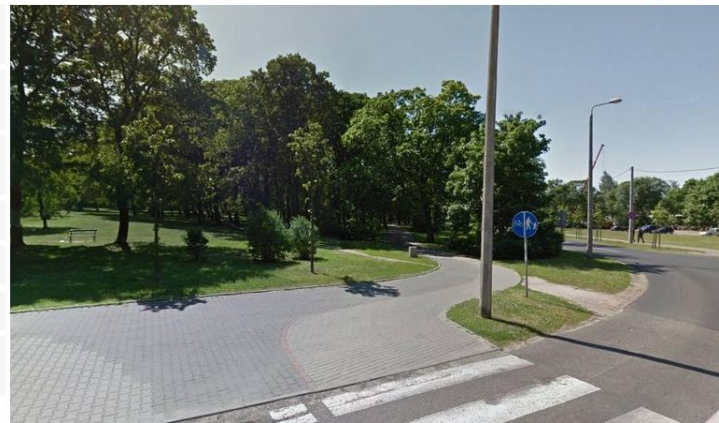
Park przy ul. Waryńskiego w Toruniu